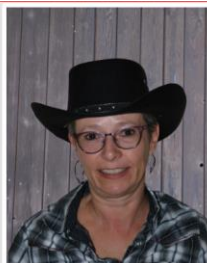
ISABELLE Sponsors, donateurs