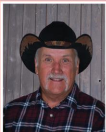
BERNARD Site, infrastructures, décoration